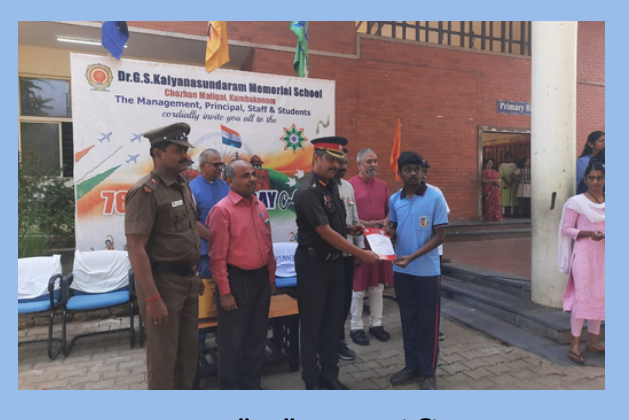
NCC "A" Certificate TN22JDA342612 RANK CDT Sharvesh R Grade A