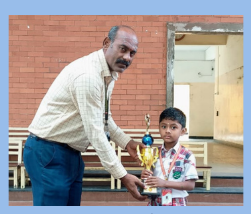
Srimurukan grade IA II price Silambam Statelevel competition